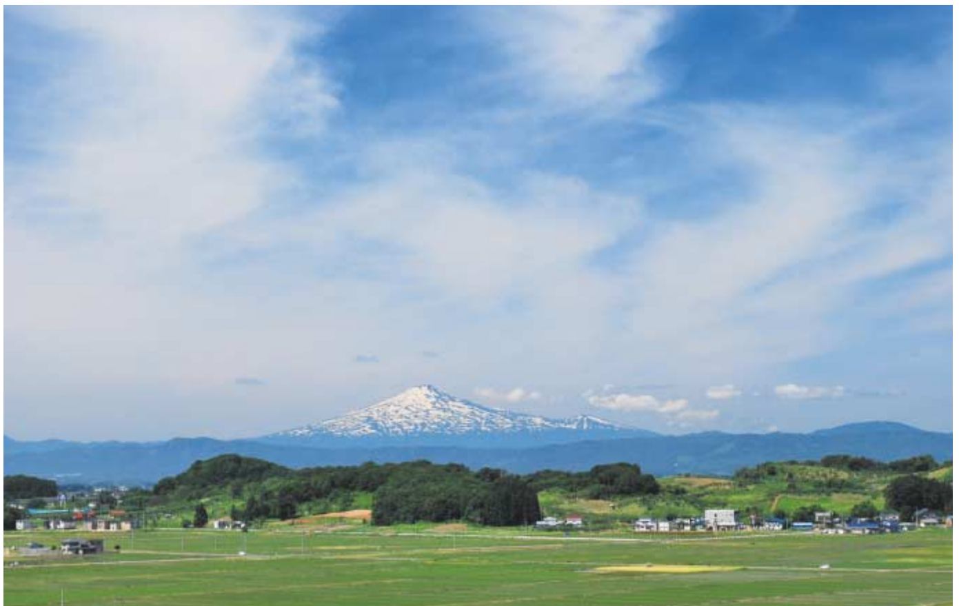
当院9階より鳥海山を望む（5月初旬）