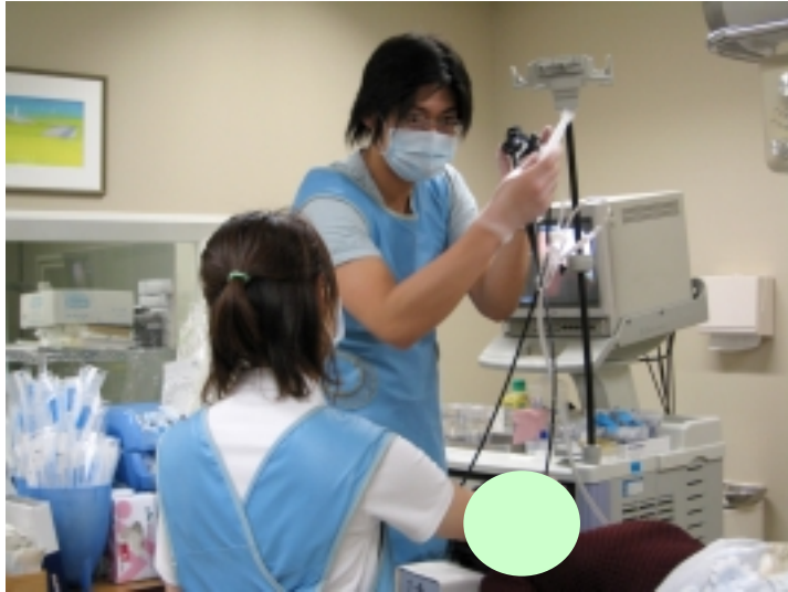
気管支鏡検査 研修医も術者です。 もちろん後ろで指導医の目が光っています。