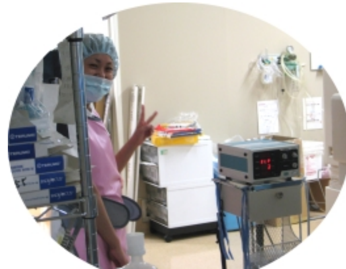
こういう人もたくさん？います（笑）