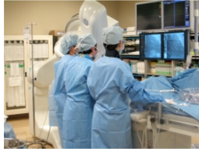
心臓カテーテル検査も多数経験できます。 研修医も術者ができます。